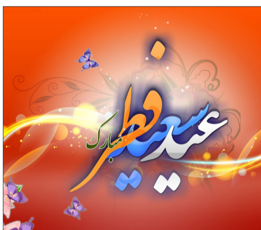
عید سعید فطر بر مسلمانان جهان مبارک باد